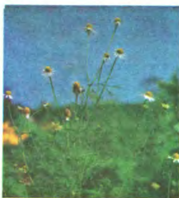
284. Ромашка лікарська.